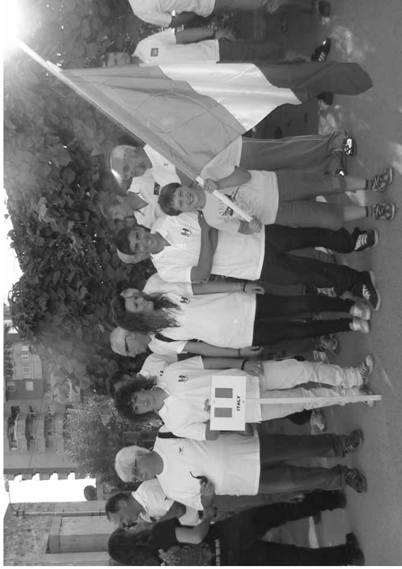
Cerimonia di apertura